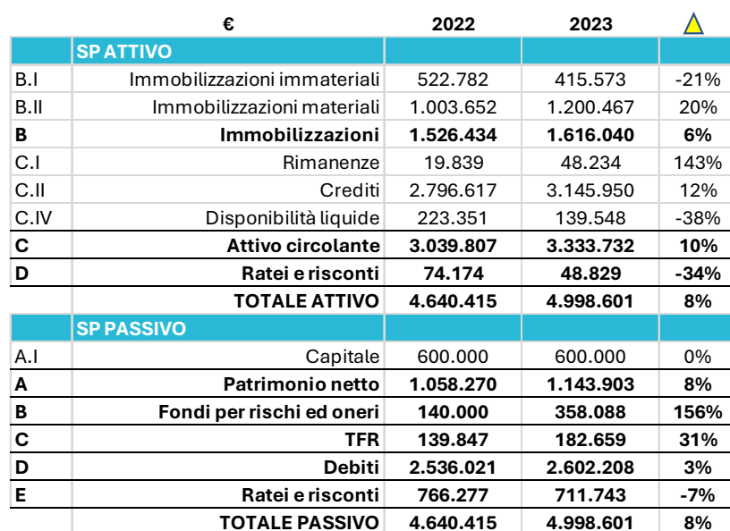
TAB. 3: STATO PATRIMONIALE 2022 E 2023